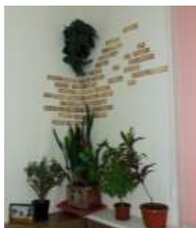
8б и 6а класс