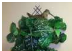
9б и 2 курс гр. «А»