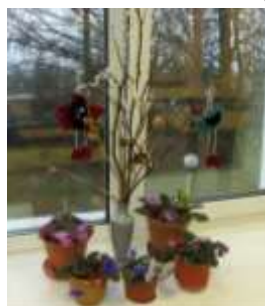
9б и 2 курс гр. «А»