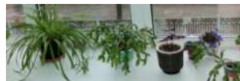
5а и 8а классы