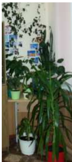
5б и 7а классы