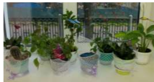
6б и 7б классы