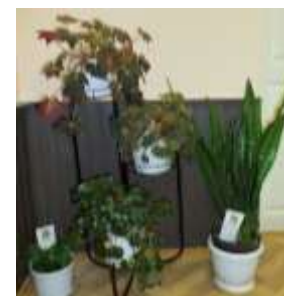
9б и 2 курс гр. «А»