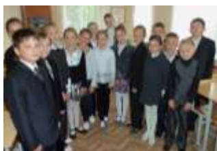
5 Б класс

Предлагаем вашему вниманию фотоотчет о прошедшем рейде.