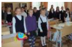
5 А класс