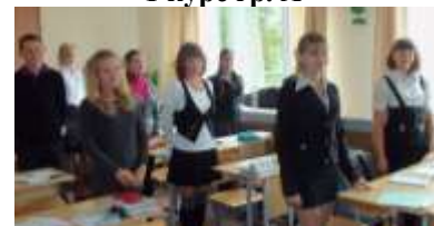
9 А класс