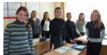
7 А класс