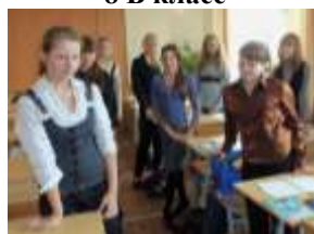
8 А класс