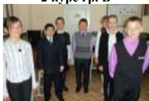
6 Б класс