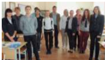
2 курс гр. А