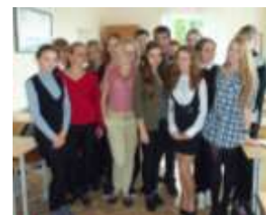
1 курс гр. А