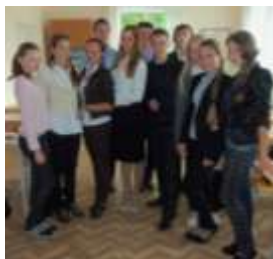
2 курс гр. Б