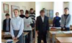
1 курс гр. Б