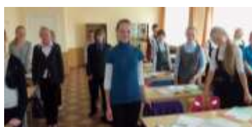
7 Б класс