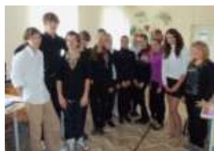
8 Б класс