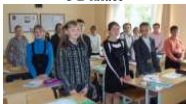
6 А класс