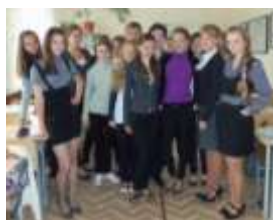
9 Б класс