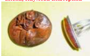
Керамическая миниатюра. Брошь