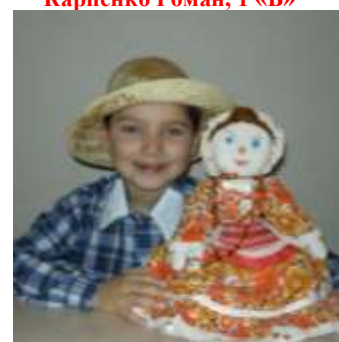
«Барыня на чайнику», Автор Чернявская Е.А.