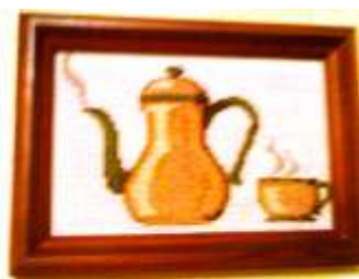
Триптих, вышивка крестом Автор Глекова Е.А.