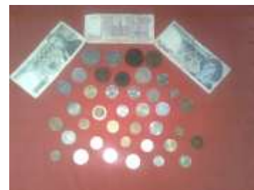
Нумизмат Карпенко Роман, 1 «Б»