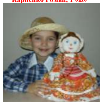
«Барыня на чайнику», Автор Чернявская Е.А.