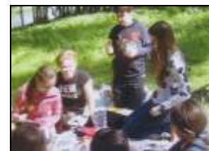
Совместные походы любят ученики 8б класса