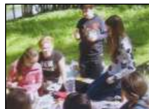
Совместные походы любят ученики 8б класса