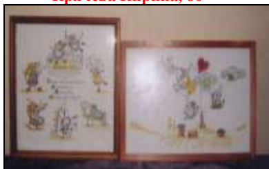
Вышивка крестом, Дубровская А.В.