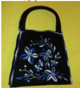
Театральная сумочка. Вышивка, Автор Чернявская Е.А.