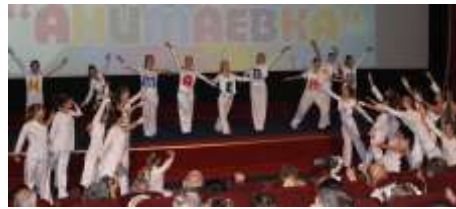
Дании, Ирака, Колумбии, Сингапура,

17 сентября в Могилеве открылся XVII Международный фестиваль «Анимаевка-2014» - форум мультипликационных фильмов, на котором были представлены 159 анимационных работ из 39 стран мира. С каждым годом этот веселый праздник расширяет границы. На этот раз впервые в нем участвуют аниматоры из Аргентины, Бразилии,