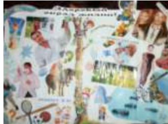
2 курс гр. А