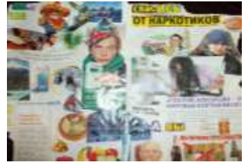
5 А класс