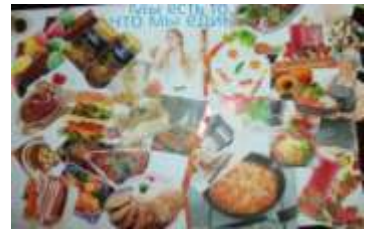
6 Б класс