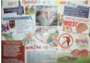
5 Б класс