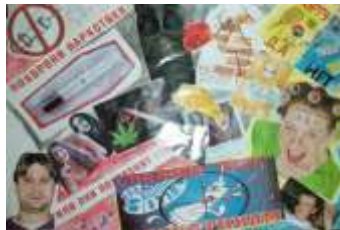
7 А класс