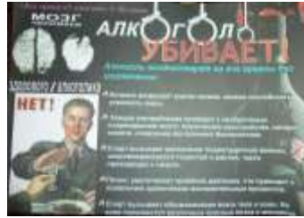
9 Б класс