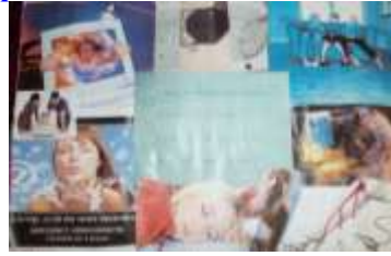
8 Б класс