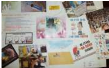
2 курс гр. Б