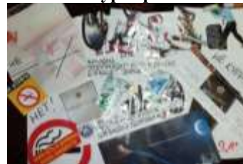
9 А класс