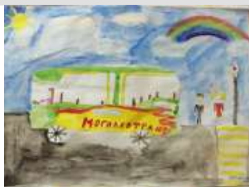
Евдокимова Юлия, 5 класс