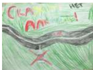
Артемов Марк, 5 класс