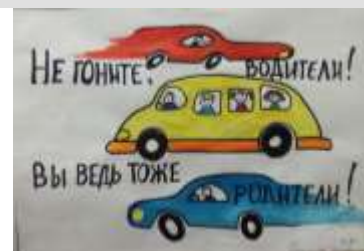
Острикова Полина, 5 класс