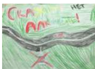
Артемов Марк, 5 класс