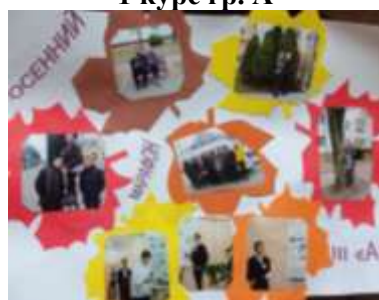
3 курс гр. А