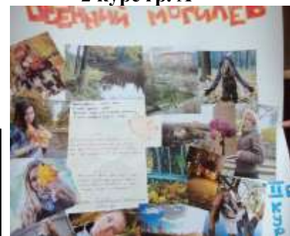
2 курс гр. Б

Все работы размещены на сайте гимназии-колледжа искусств http://mggci.by/ Жюри, в состав которого войдут педагоги и представители ученического комитета гимназии-колледжа оценит все присланные на конкурс работы