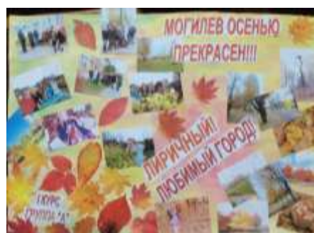
1 курс гр. А