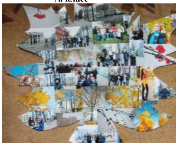
1 курс гр. Б