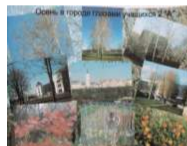
2 курс гр. А