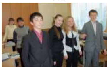
8 «А» класс