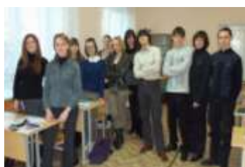
2 курс гр. «А»