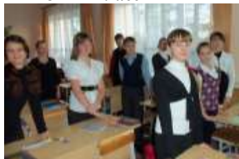
7 «Б» класс