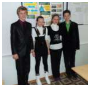
8 «Б» класс