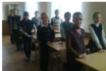
5 «Б» класс