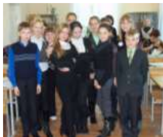
7 «А» класс