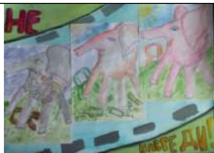
Творческая группа 6б класса