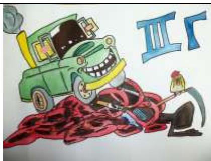
3 курс, гр. Г