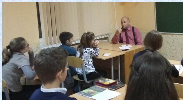
Встреча с лидерами ученического самоуправления