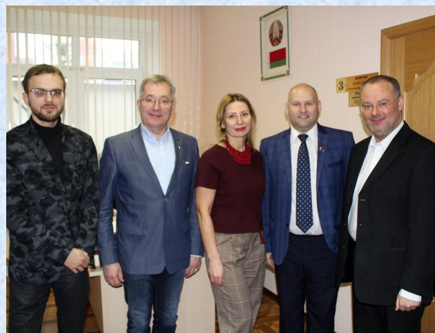
Фестиваль «Японская осень в Беларуси» и форум «Беларусь-Латвия. Музыкальные параллели»