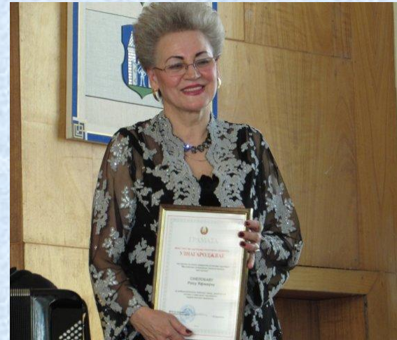
Торжественное мероприятие администрации Ленинского района г. Могилева, посвященное Дню женщин