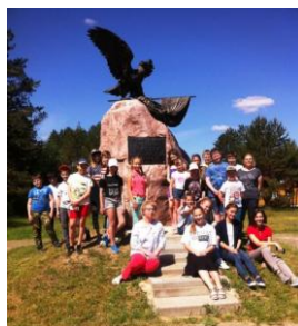
28 сентября 1708 года,

В рамках года малой родины учащиеся гимназии-колледжа активно посещают музейные экспозиции г. Могилева, совершают выездные экскурсии. Так, весной ребята посетили удивительный музей «Страна мини», который совсем недавно появился на арене музейного Минска. Учащиеся побывали сразу во всех уголках Беларуси, так как в музее представлены все самые красивые замки, монастыри, дворцы Беларуси, но в уменьшенном виде. Миниатюры знаменитого Несвижского замка, Дворца Румянцевых-Паскевичей в Гомеле, Каменецкой вежи, Жировичского монастыря, Костела Святых Симеона и Елены в Минске, Брестской крепости, Могилевской Николаевской церкви, Софийского собора в Полоцке — это воссозданные точные копии достопримечательностей, архитектурных