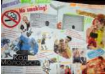
1 курс гр. А