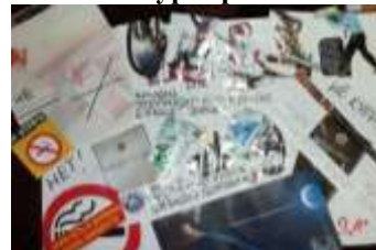
9 А класс