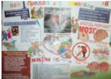
5 Б класс