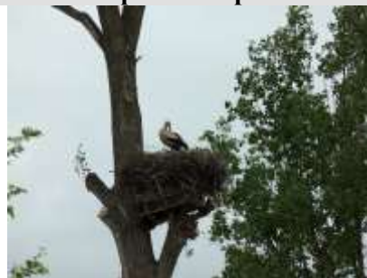
“Г светлы цень буслінага крыла...” Чернявская Е.А.