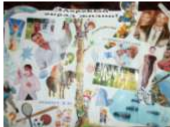
2 курс гр. А