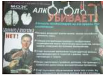
9 Б класс