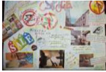
1 курс гр. Б