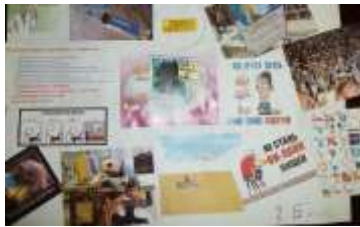
2 курс гр. Б