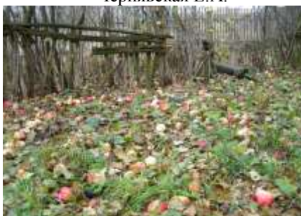
«Осень собирает яблоки в подол» Чернявская Е.А.