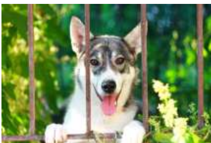
«Глядя в глаза» Валуева Алеся, 1 курс гр. Б