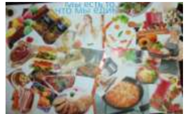
6 Б класс