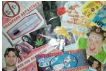
7 А класс