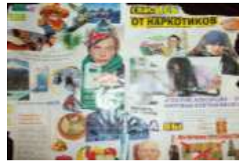
5 А класс