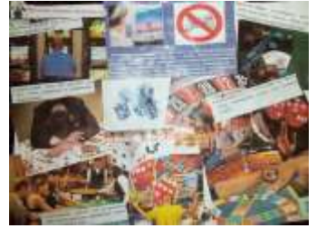
8 А класс