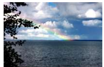
«Радужное коромысло над озером повисло» Валуева Алеся, 1 курс гр. Б