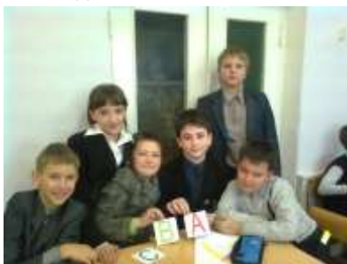
5а класс - «Виктория»

В рамках Месячника правовых знаний учащиеся 5-7 классов приняли участие в викторине «Правознайка», а учащиеся 8-х классов – в Турнире знатоков права. Целью викторин было формирование у учащихся гражданских качеств личности, воспитание уважения к своему Отечеству, формирование базисных знаний о государстве, праве, правах ребенка. Учащимся было дано домашнее задание: придумать название команды, выбрать капитана, подготовить кроссворд для команды-соперницы, повторить основные документы по правам ребенка. В викторине участвовали команды: