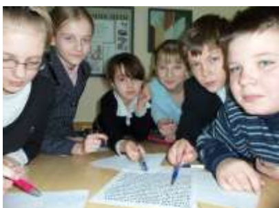
6а класс - «Удача»