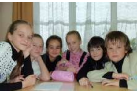
6б класс - «Правогоша»