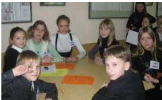
7 а класс – «Лабиринт»