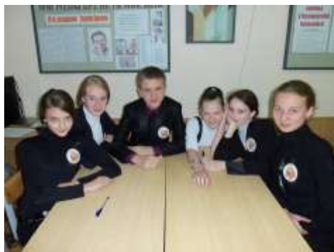
8б класс - «Апельсинчики»

Капитанам команд необходимо было составить свою предвыборную программу. И у них это неплохо получилось. Вот несколько примеров: