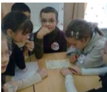
5б класс - «Счастливчики»