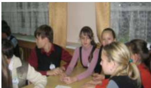
7б класс – «Libertad. Свобода»